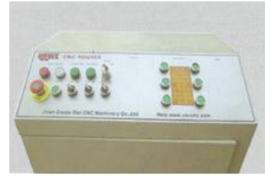
SISTEMA DE OPERACION DSP