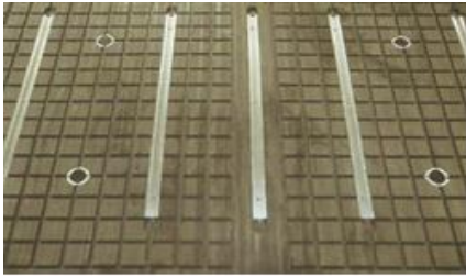
MESA DE TRABAJO AL VACIO