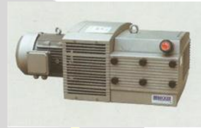
BOMBA DE VACIO