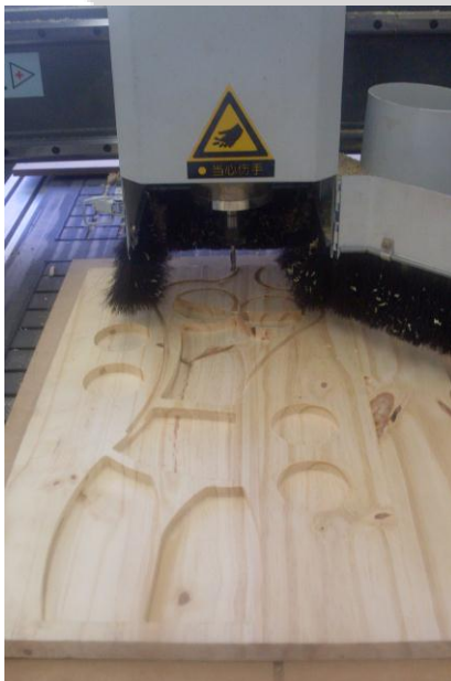
EJEMPLO DE TRABAJO